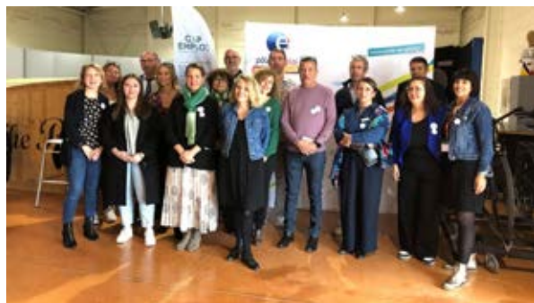
Les responsables de Pôle emploi et de Cap emploi 32.

Emploi, L'Isle-Jourdain, Société, Entreprise Publié le 22/11/2023 à 05:11